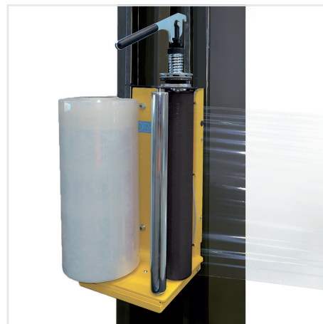
Folieslede met mechanische rem