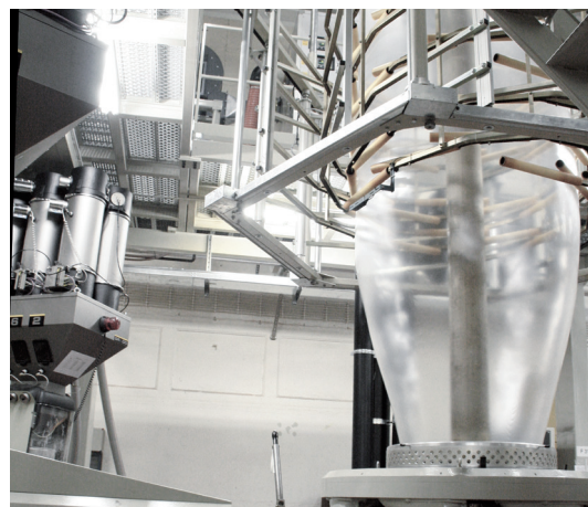
Productieproces van de geblazen rekfolie