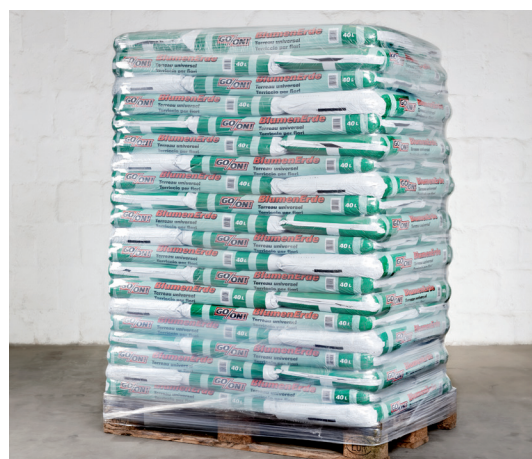
ProfiStretch MB/MBP/MBM, palletvorm aarde/turf