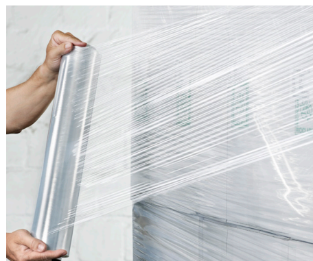
ProfiStretch HC, standaard handstretchfolies