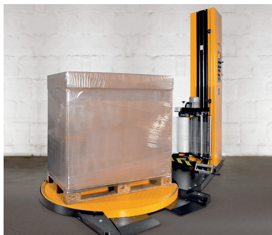
ProfiStretch MC, Standard-Castfolie