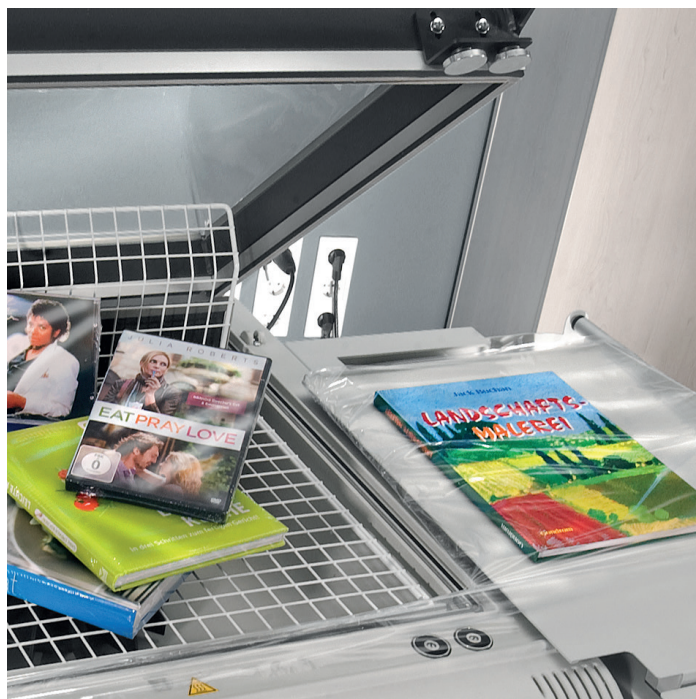
ProfiThen fijnkrimpfolie, diverse toepassingen.